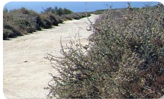
Halófilas, plantas adaptadas a los terrenos salinos

A nuestra derecha vemos las Salinas Viejas, aunque fuera de funcionamiento desde finales de los años 80 del pasado siglo, mantienen de forma natural una importante lámina de agua.